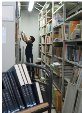
一般開架から開架書庫、開架書庫から閉架書庫へ移動します。本の大きさに合わせて棚板を移動することもあります。とても体力を使う作業です。