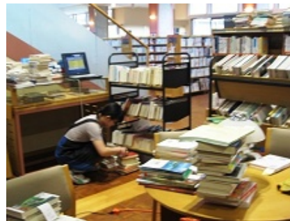
本棚の清掃と本の点検と移動。開館中に行うのは困難です。